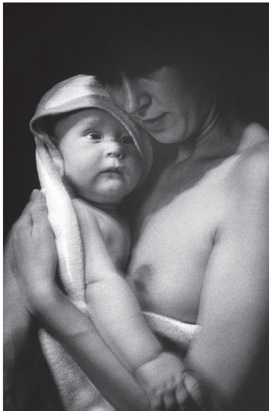
Vajar i delo 2009. ▶