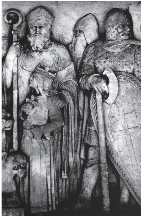
Naftaši 1988. ▶